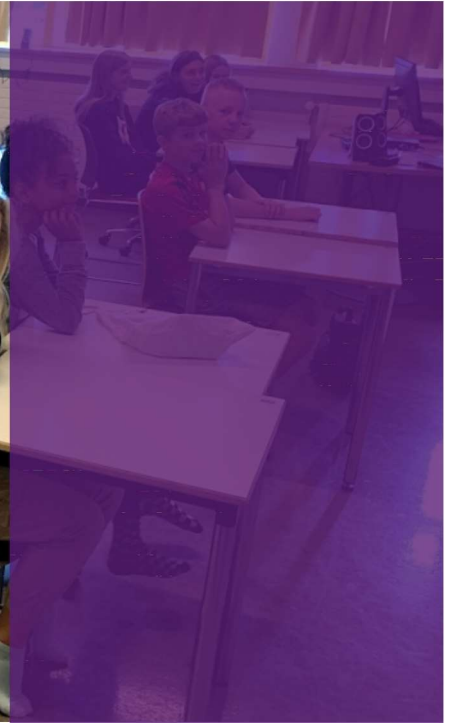
Skólaetning í 8. bekk