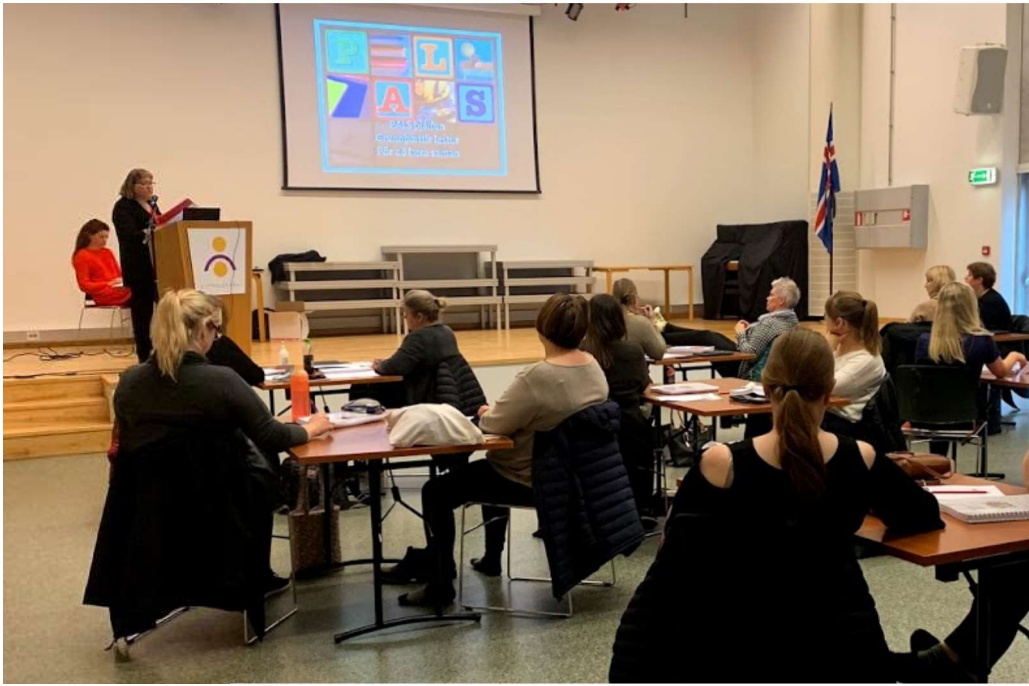
Kennarar á G-PALS námskeiði