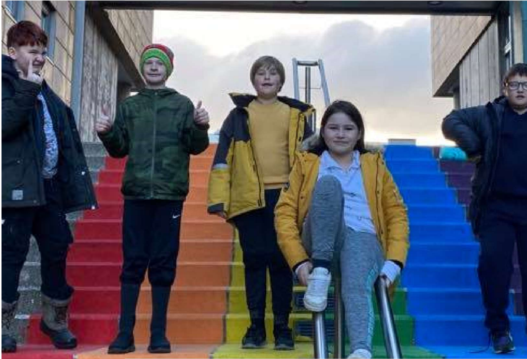
Nemendur í 7.bekk í vettvangsferð