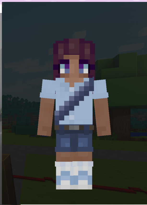
Katla litla systir