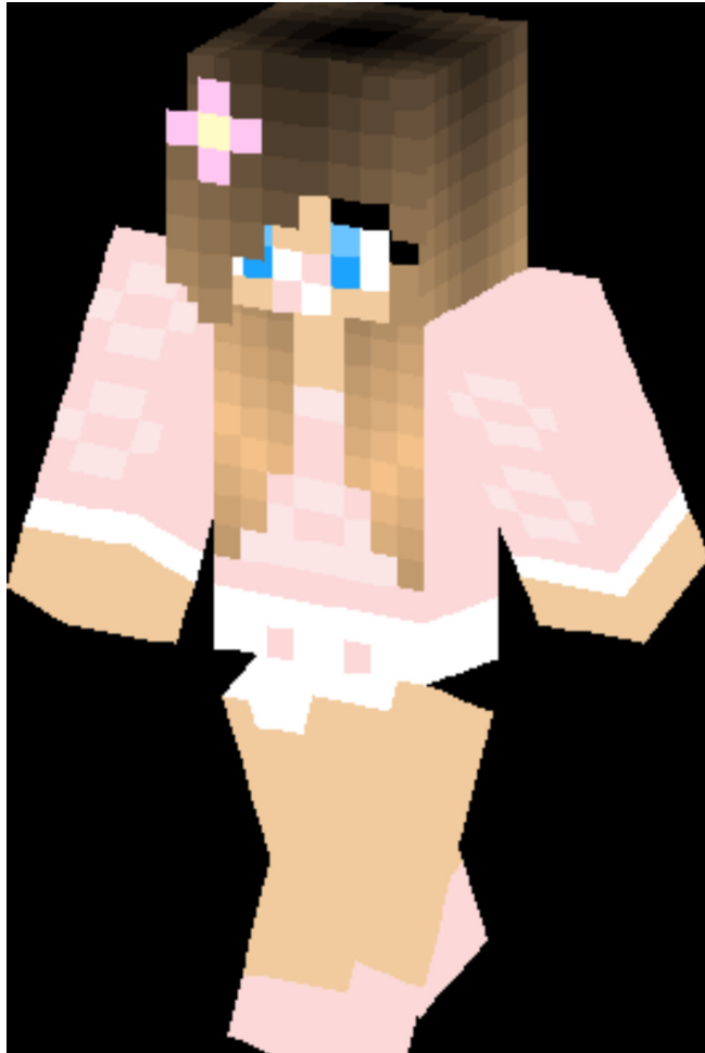
Ama litla systir